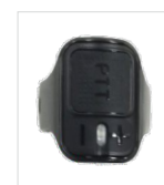
PTT de dedo sem fio