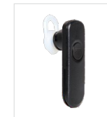
Fone sem fio