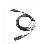
Cabo de programação USB